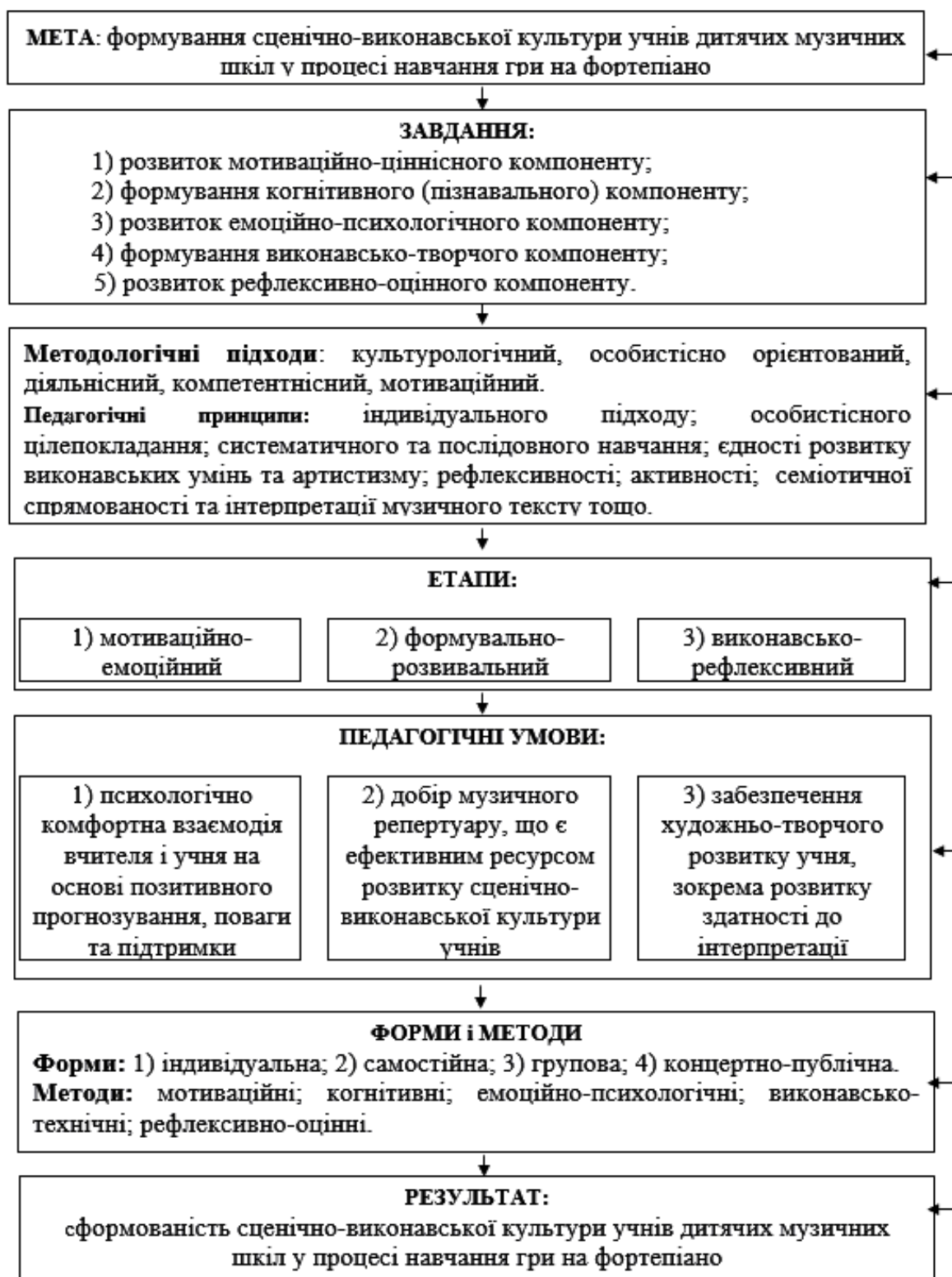
Рис. 1. Модель методики формування сценічно-виконавської культури учнів дитячих музичних шкіл в процесі навчання гри на фортепіано.

Культурологічний підхід – це сукупність методологічних прийомів, що забезпечують аналіз будь-якої сфери соціального та психічного життя на основі системотворчих культурологічних понять. У навчанні майбутніх музикантів культурологічний підхід виконує інформаційну, розвивальну, орієнтаційну,