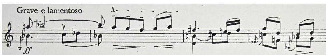
Рис. 3. Г. Крживінка. Соната. III ч. Чаконна. Тема.

Початковий розділ виконує функцію експозиції теми й є найбільш ладово окресленим. Тематизм, побудований на секундових інтонаціях і пов'язаний із матеріалом першої частини, тяжіє до h-moll; інтонаційна модель «зітхання» надає йому меланхолійного характеру, а завершення H-dur-ним акордом створює відчуття кадансової визначеності.