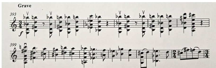
Рис.6. Я. Новак. «Sonata solis fidibus» IV ч. Grave . Тема.

Фінал сонати складається з трьох розділів ( Grave – Con moto – Grave ) і укладається у тричастинну форму (А В А). Крайні частини вже з перших акордів викликають алузії до барокових моделей, зокрема до чакони Й. С. Баха та «Фолії» А. Кореллі, що свідчить про свідоме звернення композитора до історичної традиції. Середній розділ ( Con moto ) має танцювальний характер і водночас апелює до принципів фугованого розвитку: тема послідовно проводиться в різних регістрах, формуючи поліфонічну тканину. При цьому, навіть у межах барокових жанрових алузій, композитор зберігає притаманні йому риси, зокрема варіативність метричної організації (5/8, 3/4), що надає музиці сучасного звучання.