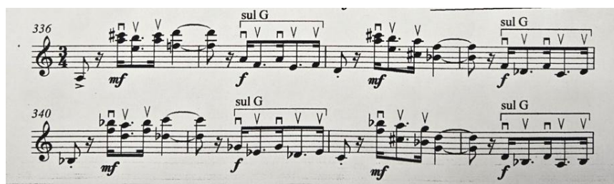
Рис. 5. «Sonata solis fidibus» III ч. Vivace . Тема середнього розділу.

Середній розділ (В) характеризується відмінними фактурними принципами організації музичної тканини: взаємодія квартольних і тріольних ритмів створює ефект ритмічного напруження. Тріольний рух набуває рис перпетуум мобіле, перериваючись акцентованими інтонаціями, що підсилюють драматичний характер. Зміни метру та поява пунктирного ритму у подальшому розвитку ускладнюють ритмічну структуру, а контрастні регістрові стрибки формують ефект діалогічності між голосами, адже звучать як «питання – відповідь» завдяки контрастному поєднанню віддалених регістрів.