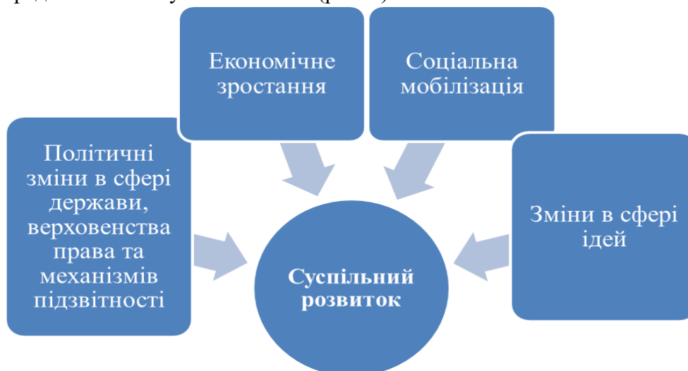
Рис. 1 Основні складові суспільного розвитку (за С. Хантінгтоном та Ф. Фукуямою)

Основні складові суспільного розвитку за висновками С. Хантінгтона та Ф. Фукуями можна представити наступною схемою (рис. 1).