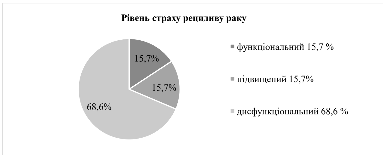
Рис. 2. Рівні страху рецидиву раку за підшкалою «тяжкість FCRI», %

Оцінка 13-16 трактується як «підвищений рівень», 16 і більше – як «дисфункціональний». За шкалою Тяжкість виявилось, що функціональний рівень страху рецидиву мають лише 15,7% учасниць нашого дослідження, ще 15,7% мають підвищений рівень страху рецидиву раку, а решта 68,6% – дисфункціональний рівень (див. Рис.2). Тобто клінічно значущий рівень страху рецидиву мають 84,3% учасників дослідження.