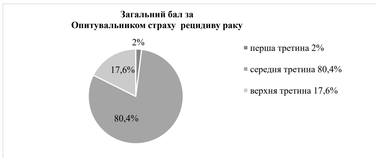
Рис. 1. Загальний бал FCR за Опитувальником страху рецидиву раку, %

Серед учасниць виявлено одну особу (2%), яка набрала надто низький бал для загальної шкали FCRI. Також виявилось, що дисфункціональний рівень (у межах верхньої третини) мають 17,6% учасниць. Отже середній загальний бал мають 80,4% учасниць дослідження, а дисфункціональний, клінічний (перша та третя третини разом) – 19,6% (див. Рис.1).