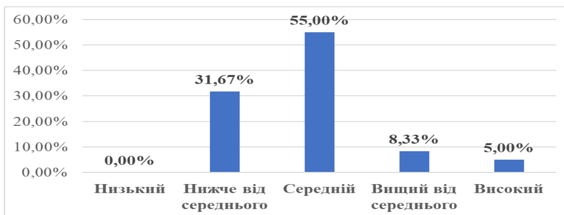
Рис. 1. Рівні за загальним показником соціального інтелекту в здобувачів вищої освіти

Одержані результати щодо рівнів за загальним показником соціального інтелекту в здобувачів вищої освіти презентовано на рис. 1.