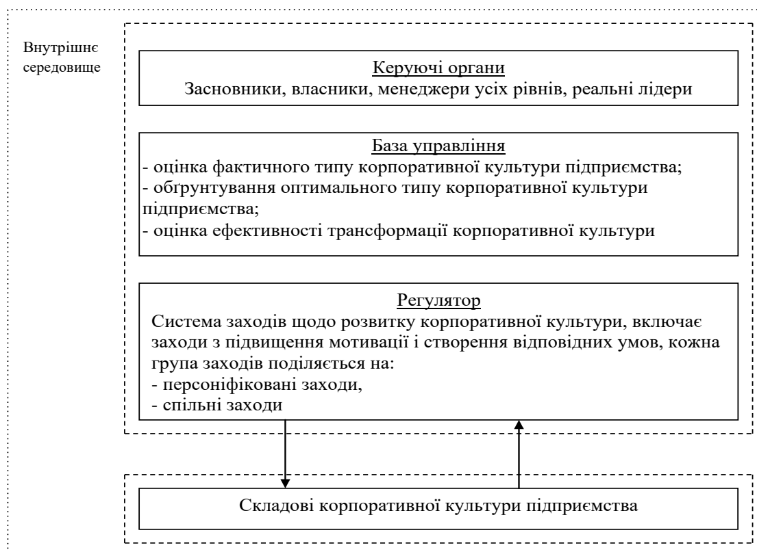
Рис. 1. Модель складових корпоративної культури підприємства чи організації (за Л. Беловою).

Метою дослідження є теоретичне обґрунтування та емпіричне дослідження ефективності застосування тренінгової моделі «Натхнення та супровід на шляху до досягнення цілі» для розвитку складових корпоративної культури майбутнього керівника. Для досягнення поставленої мети було визначено такі завдання дослідження: 1) теоретично проаналізувати поняття «культура», «корпоративна культура», «організаційна культура», «корпоративна культура в закладах вищої освіти»; 2) розробити Програму тренінгової моделі «Натхнення та супровід на шляху до досягнення цілі», спрямовану на розвиток складових корпоративної культури майбутнього керівника.