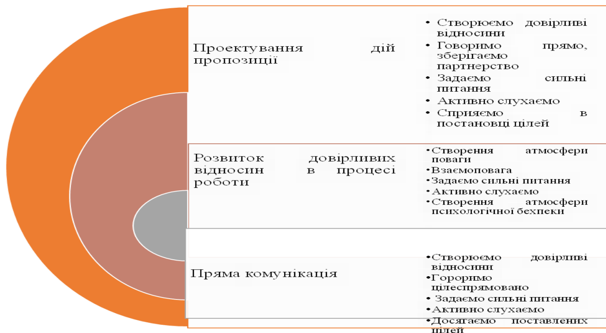
Рис. 2. Програма тренінгової моделі «Натхнення та супровід на шляху до досягнення цілей»

На основі отриманих результатів опитування для підвищення рівня корпоративної культури майбутніх керівників була розроблена тренінгова модель «Натхнення та супровід на шляху до досягнення цілей» (рис.2).