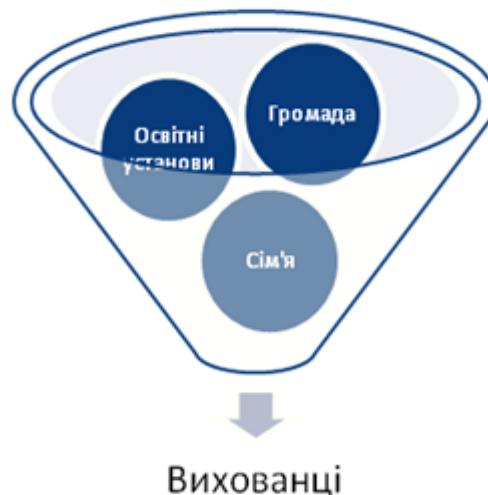
Рис.1. Модель соціального партнерства «сім'я–громада–освітні заклади»

Проаналізувавши значну кількість зарубіжних наукових робіт з проблематики соціального партнерства і спираючись на напрацювання вчених Індонезійського університету, ми мали можливість експлікувати їхній досвід на наші українські реалії й представити модель соціального партнерства у вигляді рисунку 1.