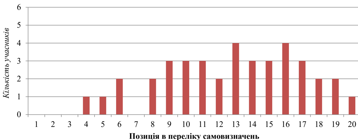
А) 2021 рік (39 відповідей серед 116 учасників)

У 2021 р. серед 39 осіб, що вказали національну ідентичність у вільному самовизначенні, ці відповіді розподілились переважно з 9 по 17 позиції – рис.1.