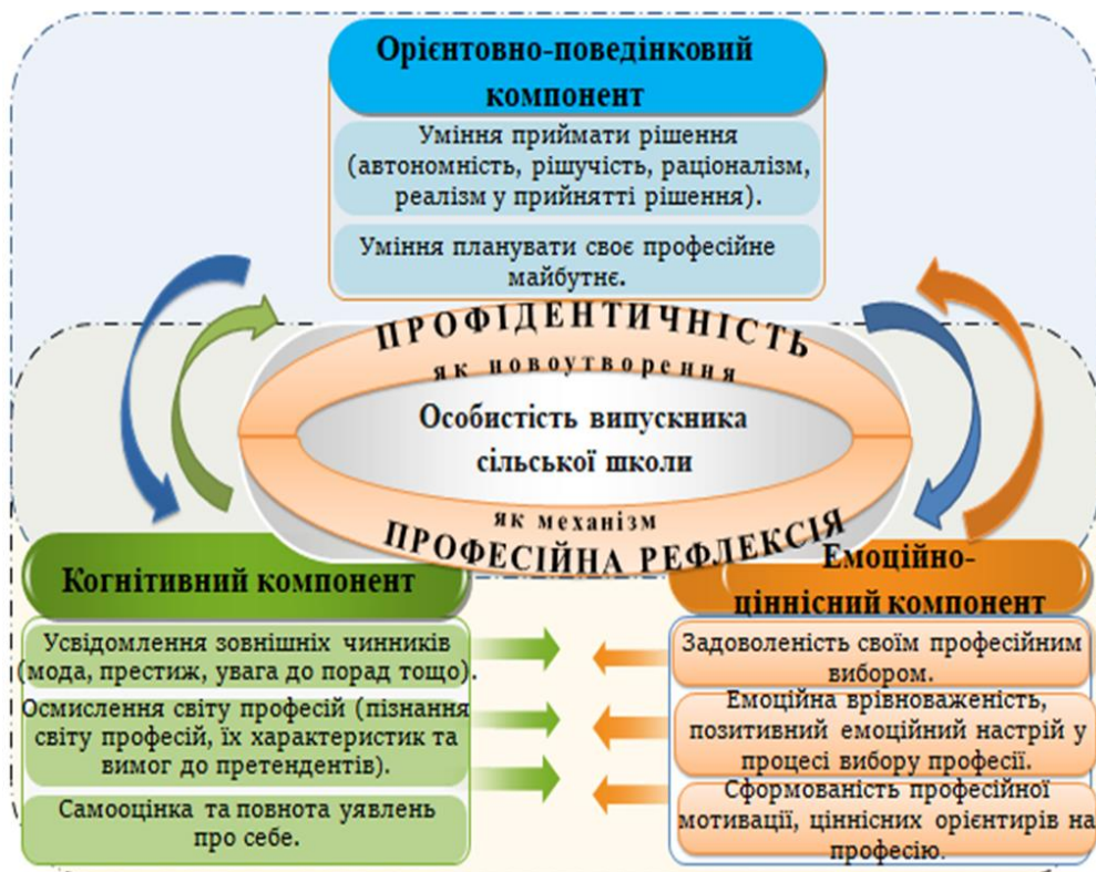
Рис. 1. Модель професійного самовизначення випускників сільських шкіл

Теоретичний аналіз дозволив презентувати модель професійного самовизначення випускників як «складноорганізовану систему взаємопов'язаних між собою компонентів і їх конструктів: когнітивний (пізнання світу професій, самооцінка власних здібностей, усвідомлення зовнішніх чинників), емоційно-ціннісний (ціннісне ставлення до вибору фаху, задоволеність своїм професійним вибором), орієнтовно-поведінковий (уміння планувати й проектувати професійне майбутнє, уміння приймати рішення)» (рис.1.).