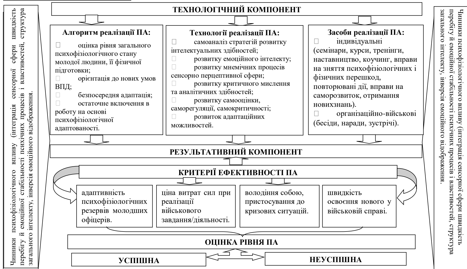
Рис.1. Теоретична модель професійної адаптації молодших офіцерів Збройних Сил України на основі врахування психофізіологічних чинників

Умовні позначення: ПА – професійна адаптація, ВПД – військово-професійна діяльність