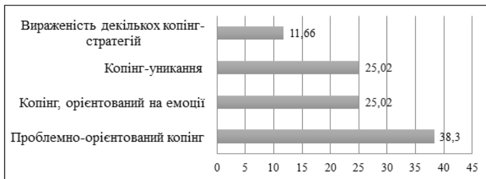
Рис. 2. Копінг-стратегії, характерні для особистості юнацького віку

Якщо проаналізувати результати дослідження домінуючого виду копіngu в стресових ситуаціях , то вони наочно презентовані на рис.2 та в табл. 2.