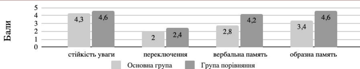
Рис.3. Результати дослідження уваги і пам'яті в основній групі і групі порівняння

Увага нестійка. Середній рівень у 40% досліджуваних. Переключення уваги також здебільшого має середній рівень. Частина дітей не зрозуміли інструкції і не змогли виконати завдання. Вербальна пам'ять переважає низький рівень. Діти здебільшого відтворювали лише перше або останнє слово. Дослідження образної пам'яті показало більш високі показники, проте, вони не виходять за межі середнього рівня для даного віку.