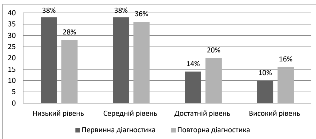
Рис. 3 Результати первинної та повторної діагностики рівня сформованості комунікативних здібностей у здобувачів спеціальності 016 Спеціальна освіта

З рис. 3 видно, що кількість здобувачів з високим та середнім рівнем розвитку комунікативних здібностей (у порівнянні з первинною діагностикою) зросла на 6% для кожного рівня, а кількість здобувачів з низьким та середнім рівне зменшився на 10% і 2% відповідно.