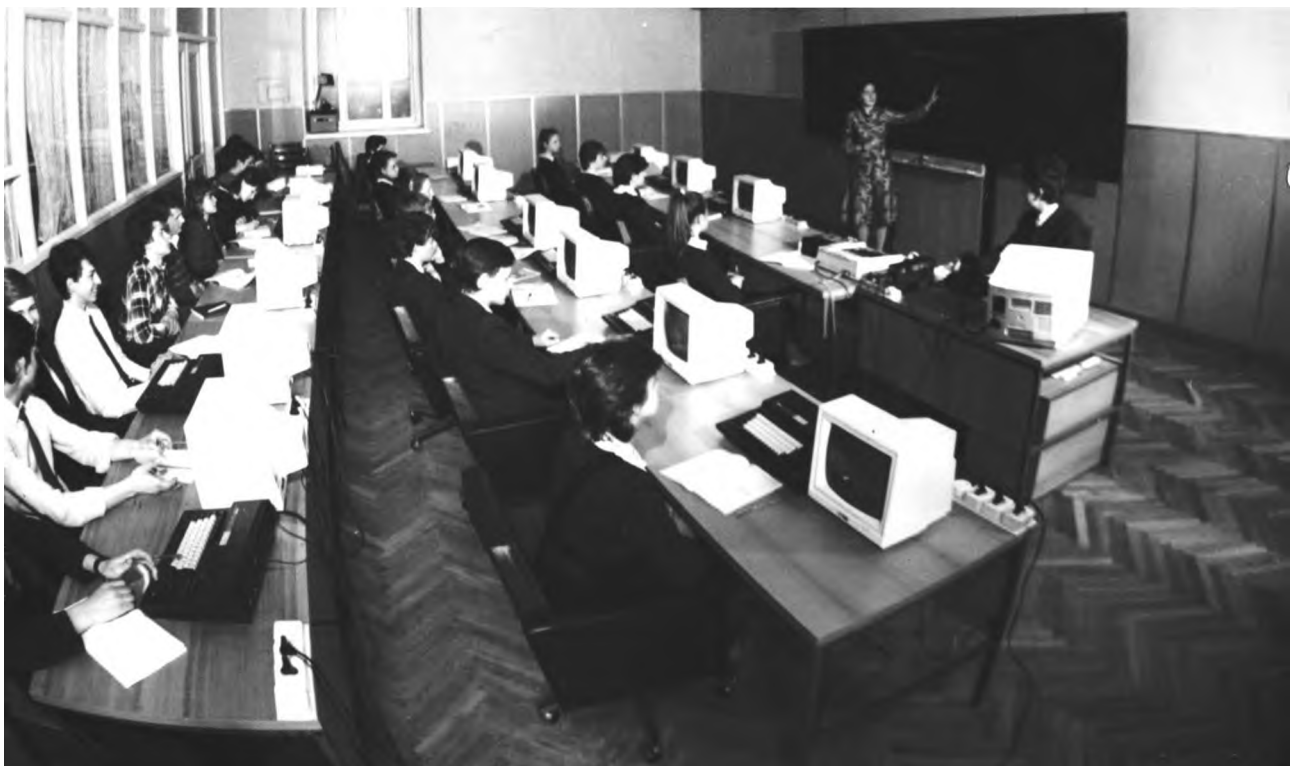
Фото 6. Клас мікрокомп'ютерів «Ямаха»

Разом з тим колектив кафедри «Основ інформатики і обчислювальної техніки» під керівництвом Миколи Івановича Шкіля досить напружено і не безплідно працював. На кафедрі з'явився комп'ютерний клас на основі досить досконалих на той час персональних комп'ютерів «Ямаха», в зв'язку з чим програмовані мікрокалькулятори відійшли в минуле. У комп'ютерів «Ямаха» було досить досконале на той час програмне забезпечення, яке зберігалось в постійній пам'яті комп'ютера – операційна система MS DOS, редактор текстів TOR, бази даних DBase-II, електронні таблиці Multiplan, графічний редактор Painter, музичний редактор, географічний атлас тощо.