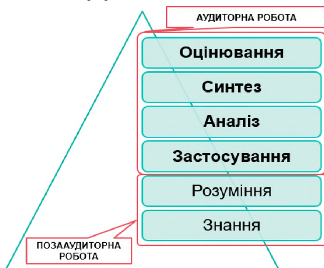
Рис. 3. Використання перевернутого навчання та таксономія Блума

Для ефективного використання відео-матеріалів під проектування електронного навчального курсу розглянемо детальніше освітню мету застосування технології перевернутого навчання (рис.3.), яка може базуватися на таксономії Блума [6], модифікованій Андерсоном та Кратволем [1]. Відповідно до цієї таксономії існує шість рівнів когнітивних здобутків: знання, розуміння, застосування, аналіз, синтез і оцінювання. У перевернутому навчанні те, що студенти виконують в рамках позааудиторної роботи, належить до знань і розуміння, тобто до нижчих рівнів когнітивного навчання, адже відео-матеріали використовуються для ознайомлення студентів з базовим матеріалом. Під час проведення аудиторних занять формуються навички вищих рівнів когнітивного мислення, такі як аналіз, синтез та оцінювання [8]. Роль викладача в аудиторії змінюється – він стає ведучим, застосовує дискусії, організовує спільну навчальну діяльність, групову роботу, проекти, сприяє розвитку у студентів здатності до саморефлексії.