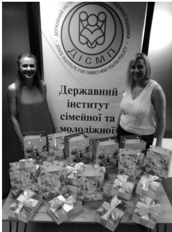
На світлині: подарунковий комплект книг Романа Расевича, присвячених українському дитячому сокільству.