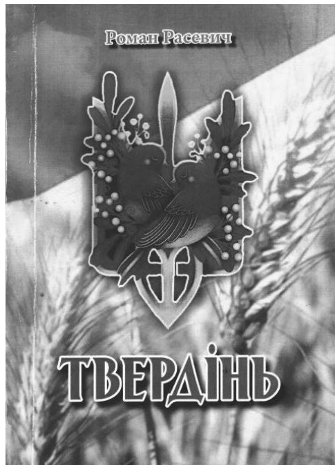
На обкладинці книги — Герб України роботи художниці Поліни Скурихіної.

Вулиці в українській традиції завжди ведуть до майданів, де кожна людина може постати перед очима іншої рідної людини віч-на-віч, а отже, творити віче для спілкування на одному полі, бо спілкування передбачає наявність людей з одного поля — спільноти, спілки.