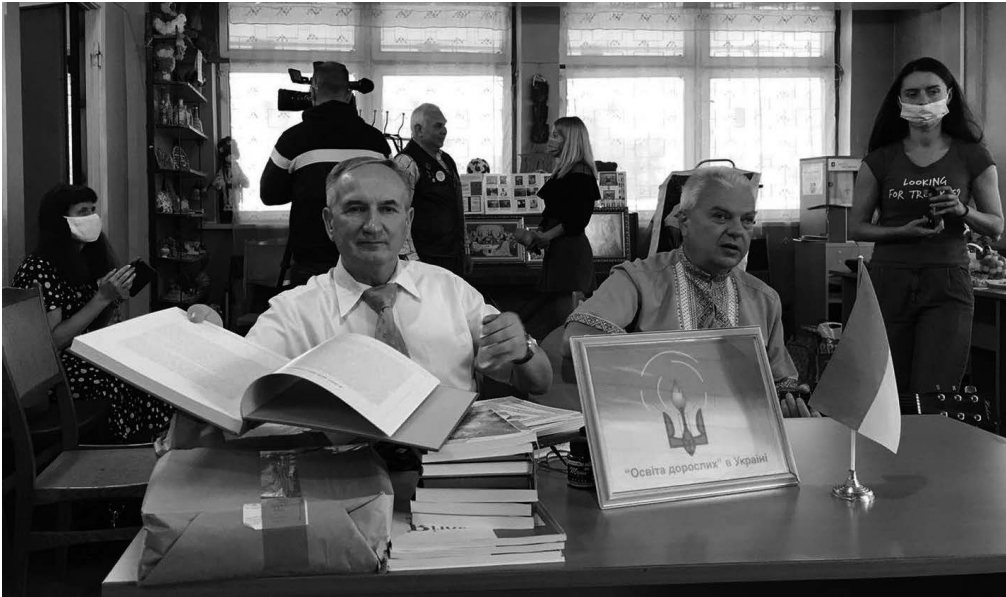
Зображення 2. Різноманітність форм навчання на «Тижні освіти дорослих» втілюється індивідуально й одночасно (Центральна спеціалізована бібліотека для сліпих імені Миколи Островського, Київ).