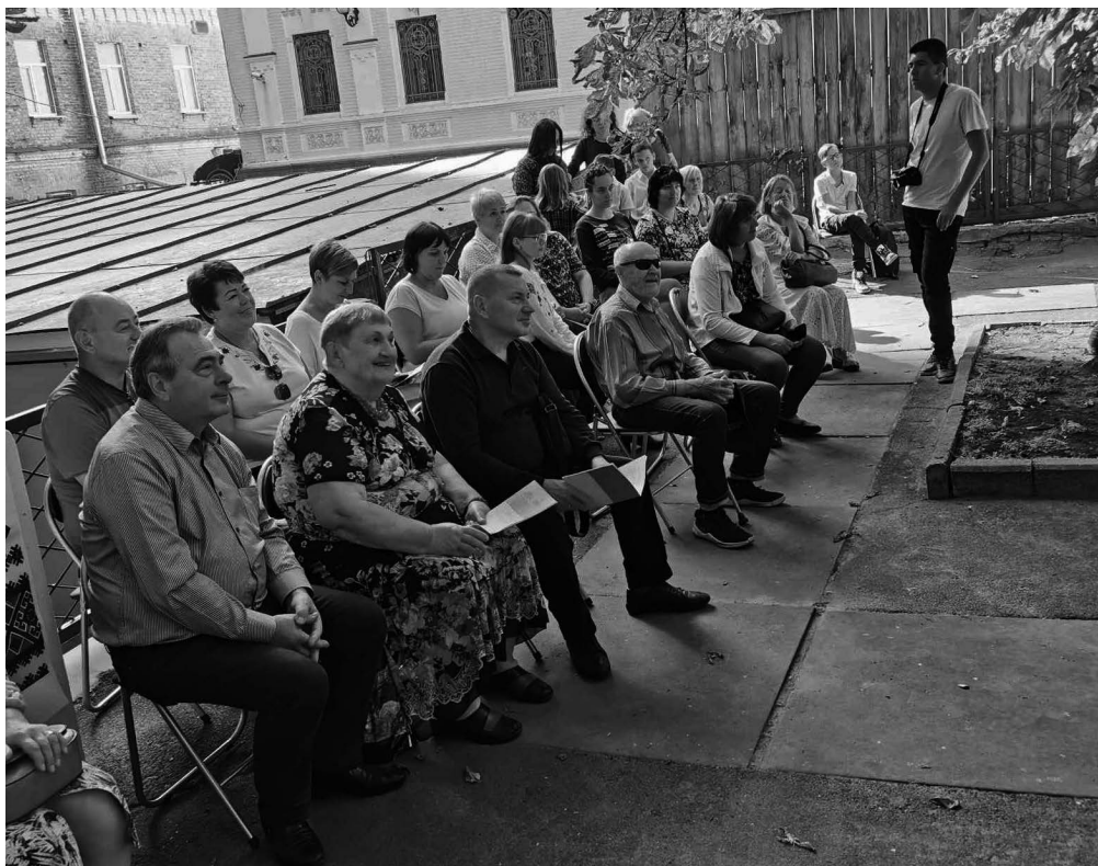
Зображення 4. Навчання дорослих між каштанами Андрія Малишка і Платона Майбороди, під якими був написаний «Київський вальс».