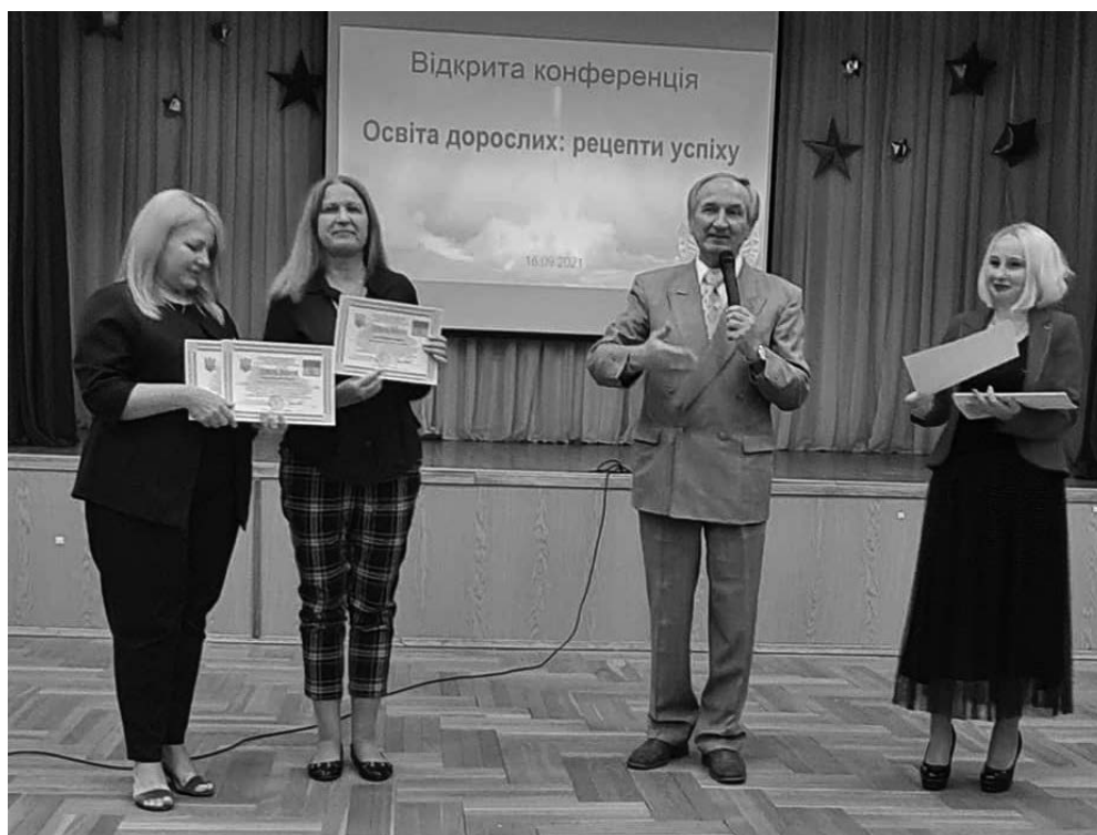
Зображення 5. Відзначення дорослих учнів — директорів київських шкіл у загальноосвітньому навчальному закладі м. Києва «Скандинавська гімназія».

Форум дорослих дозволив розкрити, осмислити й відшукати конкретне застосування знанням про розвиток дорослої людини як суб'єкта творчої діяльності, компетентностей для життя в XXI столітті, мотивацію та створення комфортних умов праці для забезпечення безперервного професійного вдосконалення, акмеологічний і аксіологічний підходи.